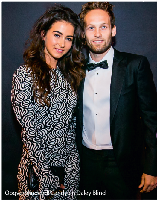
Oogverblindend! Candy en Daley Blind