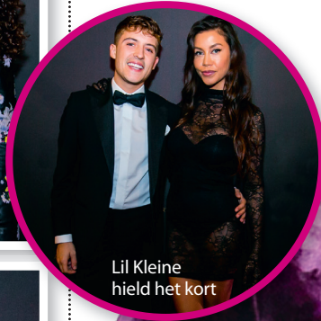
Lil Kleine hield het kort